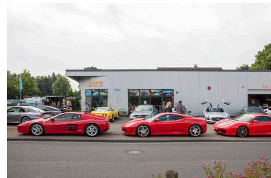
Großes Treffen der Supersportwagenfahrer und -fans bei Swim & Sweat in Dinslaken.